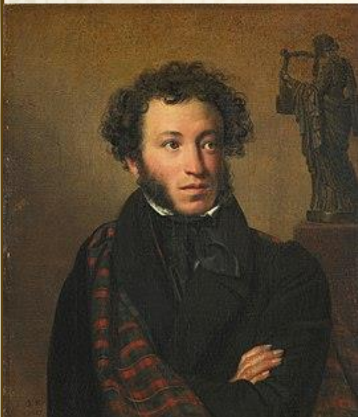
А. С. ПУШКИН

«Русский язык — это выразительный и звучный язык, гибкий и мощный в своих оборотах и средствах, переимчивый и общительный в своих отношениях к чужим языкам. Ему свойственны величавая плавность, яркость, простота и гармоническая точность. Язык — это и есть народ!»