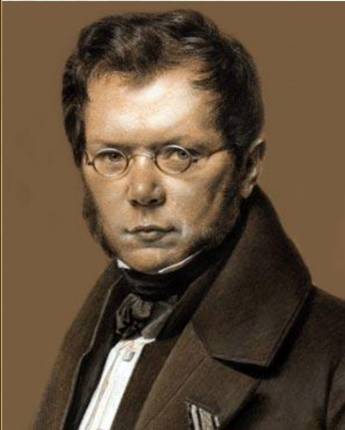
П. А. ВЯЗЕМСКИЙ

«Родной язык нам должен быть главною основою и общей нашей образованности и образования каждого из нас»