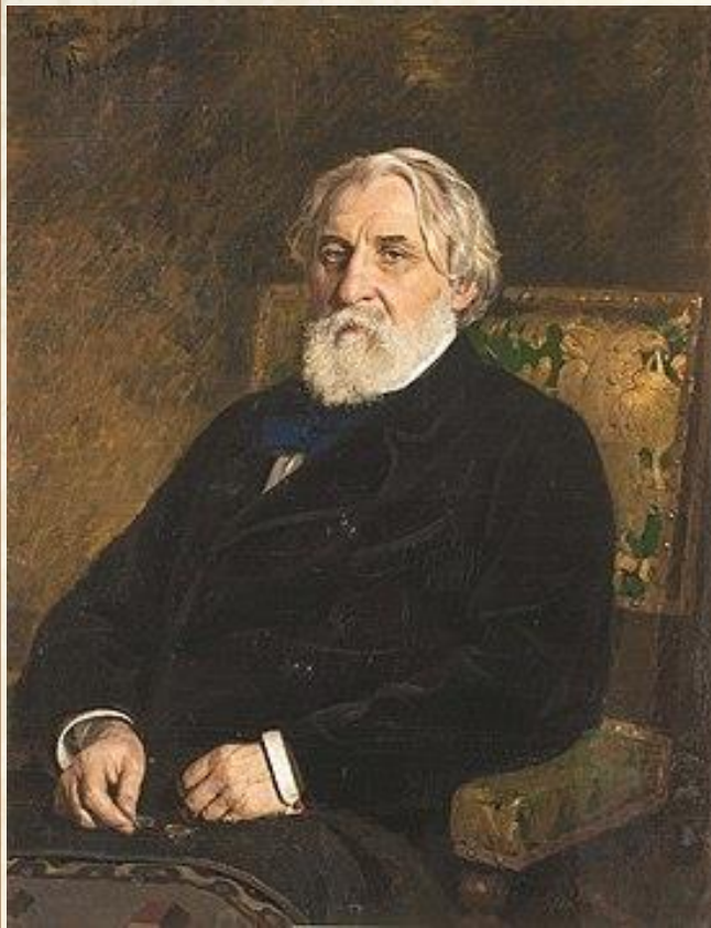
И. С. ТУРГЕНЕВ

«Во дни сомнений, во дни тягостных раздумий о судьбах моей родины — ты один мне поддержка и опора, о великий, могучий, правдивый и свободный русский язык! Нельзя верить, чтобы такой язык не был дан великому народу!»