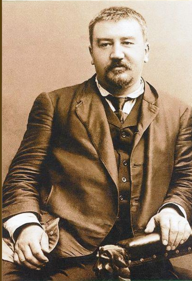
А. И. КУПРИН

«Язык — это история народа. Язык — это путь цивилизации и культуры... Поэтому-то изучение и сбережение русского языка является не праздным занятием от нечего делать, но насущной необходимостью»