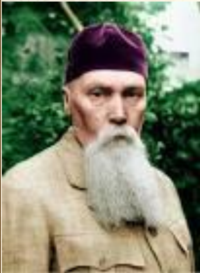
Н. К. РЕРИХ

«Истинно, великому народу дан и великий язык»