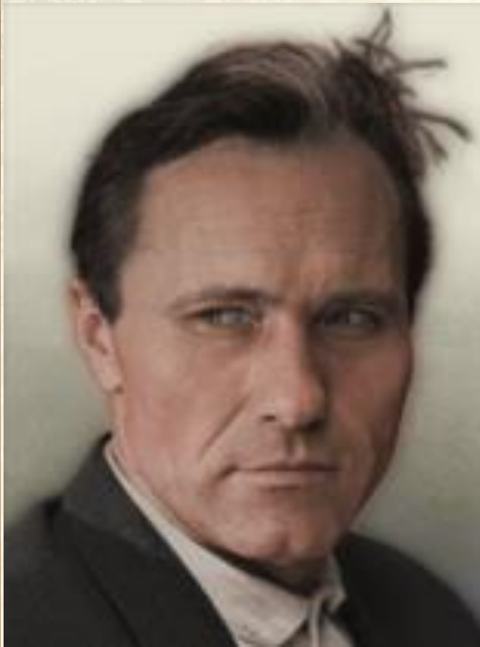
В. М. ШУКШИН

«Русский народ за свою историю отобрал, сохранил, возвел в степень уважения такие человеческие качества, которые не подлежат пересмотру: честность, трудолюбие, совесть, доброту. Мы из всех исторических катастроф вынесли и сохранили в чистоте великий русский язык, он передан нам нашими дедами и отцами. Уверуй, что все было не зря: наши песни, наши сказки, наши неимоверной тяжести победы, наше страдание — не отдавай всего этого за понюх табаку. Мы умели жить. Помни это. Будь человеком»