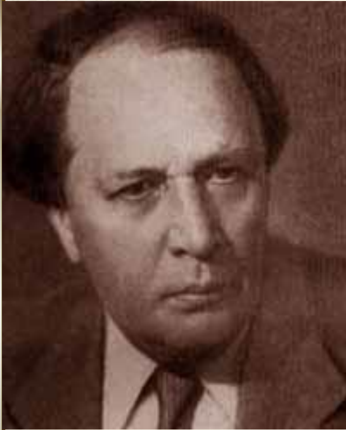
А. Н. ТОЛСТОЙ

«Русский народ создал русский язык, яркий, как радуга после весеннего ливня, меткий, как стрелы, певучий и богатый, задушевный, как песня над колыбелью»